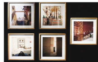
©Daphné Bengoa, « Je te fais ma demeure ». Vue d'exposition au Frac Centre-Val de Loire